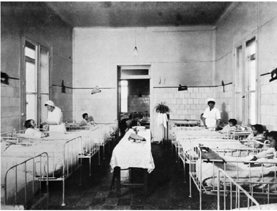
Çocuk Cerrahisi kliniğinde bir koğuş (Tıp Fakültesi 1938 Mezunları Albumü)