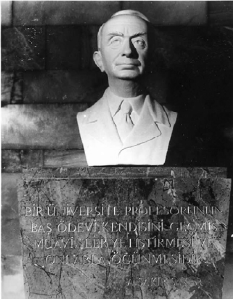
Emekliye ayrılırken kliniğin girişine yerleştirilen büstü

Fransa, Almanya ve İsviçre’de yayınlanmış 24 orijinal araştırması, Türk tıp dergilerinde yayınlanmış yüze yakın yazısı vardır. Ölümünden bir yıl önce, Atatürk’ün ilke ve devrimleriyle ulusumuza çizdiği yönün önemini bir kez daha hatırlatan “Kısaca Humanizma ve Doğanın