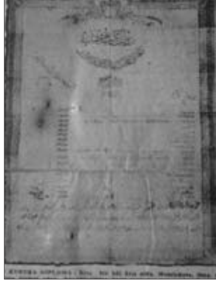
Resim 1. Mazhar Osman'ın Üsküdar Mülki İdadisi'nden aldığı diploma ile ilgili gazete haberi 25

Babası, çalıştığı bankanın Üsküdar (İstanbul) şubesine terfiyen tayin edilince, 1894 yılında Üsküdar'a taşınmışlardır. 1895 yılında yatılı okumak üzere Üsküdar Mülki İdadisi'ne kaydolmuştur. Okulda Arapça, coğrafya, hendese, cebir, tarih ve Türkçe derslerinde çok başarılı olduğu için, ileride şair veya yazar olmaya karar vermiş, hatta Üsküdar İdadisi'nde okurken bir ara arkadaşlarıyla birlikte gazete de çıkarmıştır. 1898 yılında Üsküdar Mülki İdadisi'nden "aliyyül'âlâ" derecesiyle, okul birincisi olarak mezun olduktan sonra (Resim 1) Mekteb-i Mülkiye'ye girerek idareci olmak istemişse de, yaşı küçük olduğu için imtihana alınmamıştır. Bunun üzerine mühendis olmak isteyen Mazhar Osman, o dönemde ülkedeki sanayi kuruluşlarının yabancıların elinde olması ve Türklerin buralarda mühendis olarak çalışma imkânlarının kısıtlı olması sebebiyle bu isteğinden vazgeçmek zorunda kalmıştır. Bundan sonra babasının, hekim olması yolundaki telkini doğrultusunda ve ailesine daha fazla maddi anlamda yük olmamak için, isteksiz bir şekilde Mekteb-i Tıbbiye-i Askeriye-i Şâhâne'nin giriş imtihanlarına başvurmuştur. 6, 14