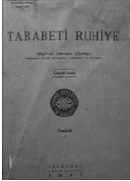
Resim 2. İlk Türkçe modern psikiyatri kitapları arasında yer alan ve Mazhar Osman tarafından yazılan Tababeti Ruhiye'nin 1. cildinin 1941 tarihli baskısının ön kapağı 26