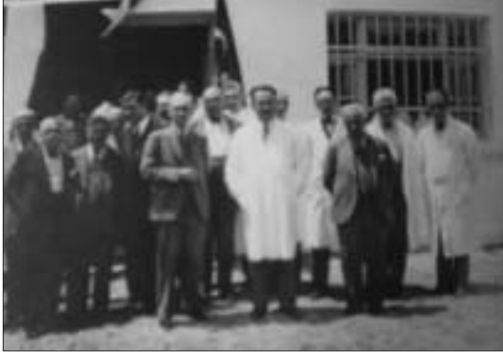
Resim 5. Mazhar Osman ve diğer hekimler Bakırköy Hastanesi'nin önünde 10

teşrih-i marazi (patolojik anatomi) laboratuvarları taşınmış, nöroşirurji ve asabiye (nöroloji) pavyonları ile röntgen dairesi kurulmuştur. 6,19