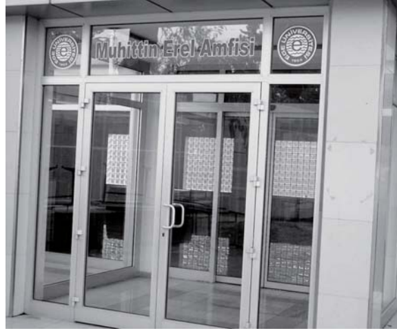
Resim 3. Ege Üniversitesi Tıp Fakültesinde onun ismini taşıyan amfinin girişi.