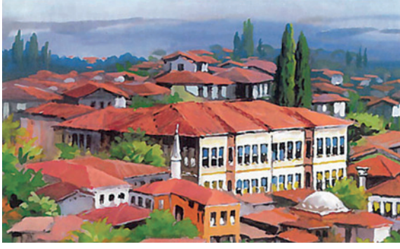
Şekil 1: Tıbhane-i Amire binası 6 Resim: Ahmet Yakupoglu