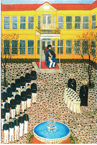
Şekil 2: Tıbhane-i Amire'deki nişan töreni 6 Minyatür: Ülker Erke

ve günümüzde eğitimine halen devam etmekte olan bu yeni okul 14 Mart 1827 tarihinde açılmış ve eğitime başlamıştır. 6 Yine Mustafa Behçet Efendi'nin önerisi ile okulda Cerrah Sınıfı açılmıştır. Böylece daha kısa süreli eğitimle ordunun cerrah ihtiyacı karşılanacaktır. Bu girişim cerrahlik okulu Cerrahhane-i Mamure'nin açılmasını hazırlamıştır (1832). 7