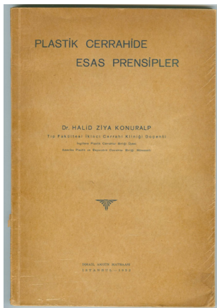
Resim 4. Plastik cerrahi prensipleri kitabı