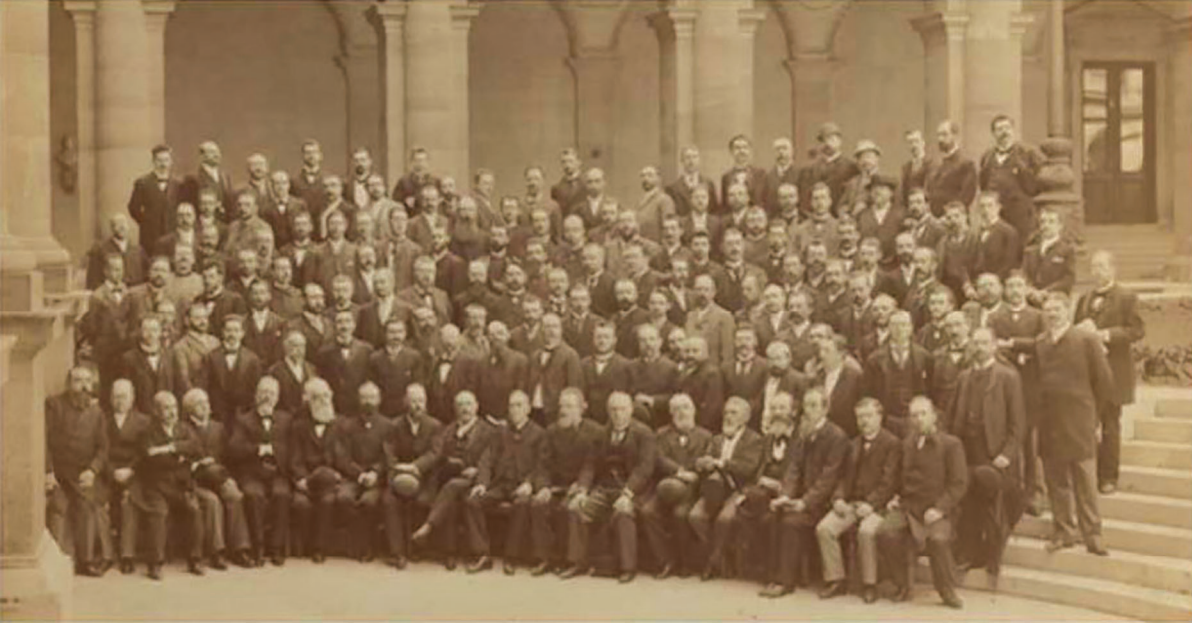
Resim 3. 2. Uluslararası Dermatoloji ve Sifiliz Kongresi 1892 Viyana