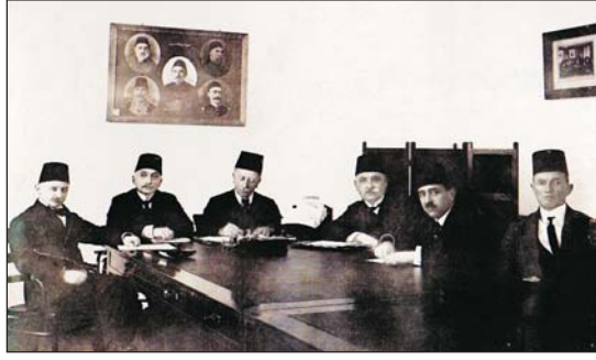
Hilal-i Ahmer Heyeti toplantısında

Öğrencilerine bakmayı değil "görmeyi" öğretti.