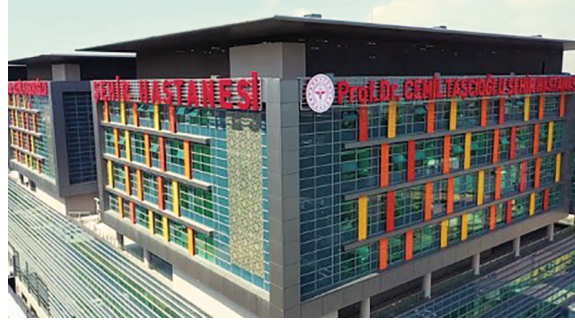
Resim 9. Prof. Dr. Cemil Taşcıoğlu Şehir Hastanesi