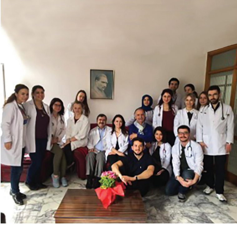
Resim 5. Vizit sonrası pozu