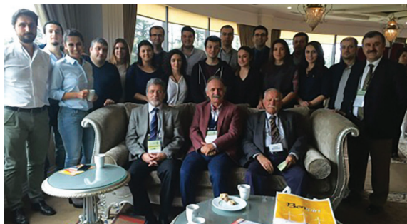
Resim 4. İstanbul Tıp Fakültesi Geleneksel İç Hastalıkları Günleri Sapanca (13 Mart 2016)