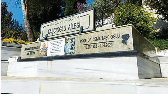
Resim 8. Üsküdar Nakkaştepe mezarlığındaki kabri