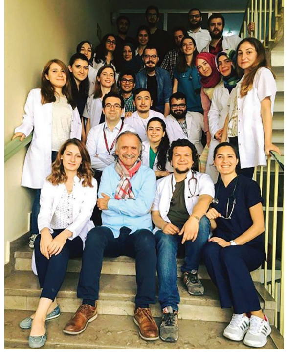
Resim 6. Vizit sonrası öğrencileriyle geleneksel merdiven pozu