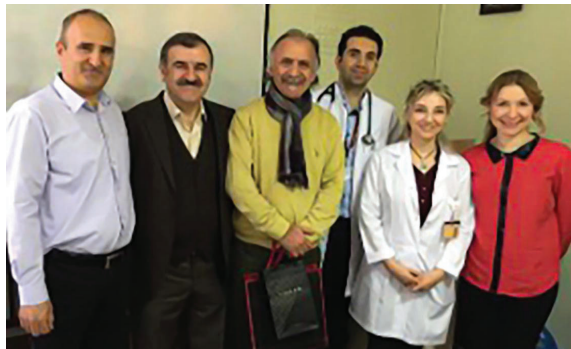
Resim 3. Çalışma arkadaşları ile vızit sonrası